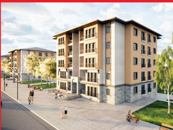
KONYA / BEŞEHİR TOKİ 3. ETAP 317 KONUT