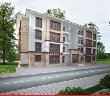
GAZİANTEP / NURDAĞI 211 KONUT ve TİCARET MERKEZİ