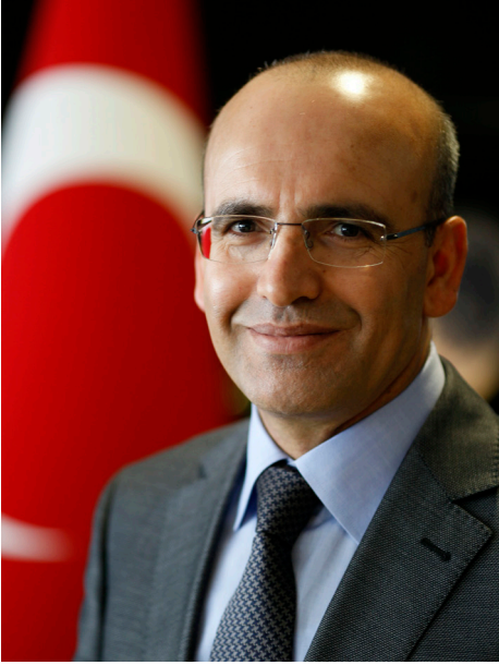
Hazine ve Maliye Bakanı Mehmet Şimşek

"Politika faizi, enflasyonun ana eğilimini geriletecek ve enflasyonu orta vadede %5 hedefine ulaştıracak parasal ve finansal koşulları sağlayacak şekilde belirlenecek. Enflasyon görünümü ve yukarı yönlü riskler göz önüne alındığında kurul, para politikası çerçevesinin güçlendirilmesi gerektiği değerlendirilmesinde bulundu.