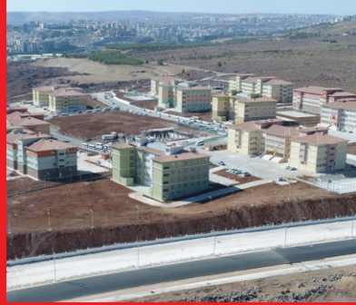
ŞANLIURFA / HALİLİYE ZEYTİN DALI EĞİTİM KAMPÜSÜ