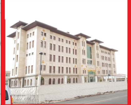
ŞANLIURFA / SİVEREK İLÇE EMNİYET BİNASI