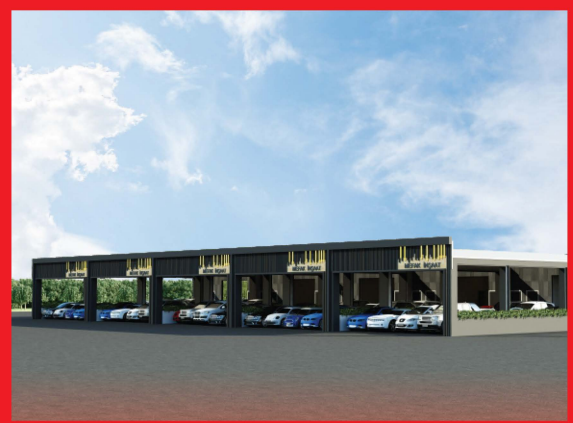
MEFAK OTO GALERİ SİTESİ ŞANLIURFA (proje devam ediyor)